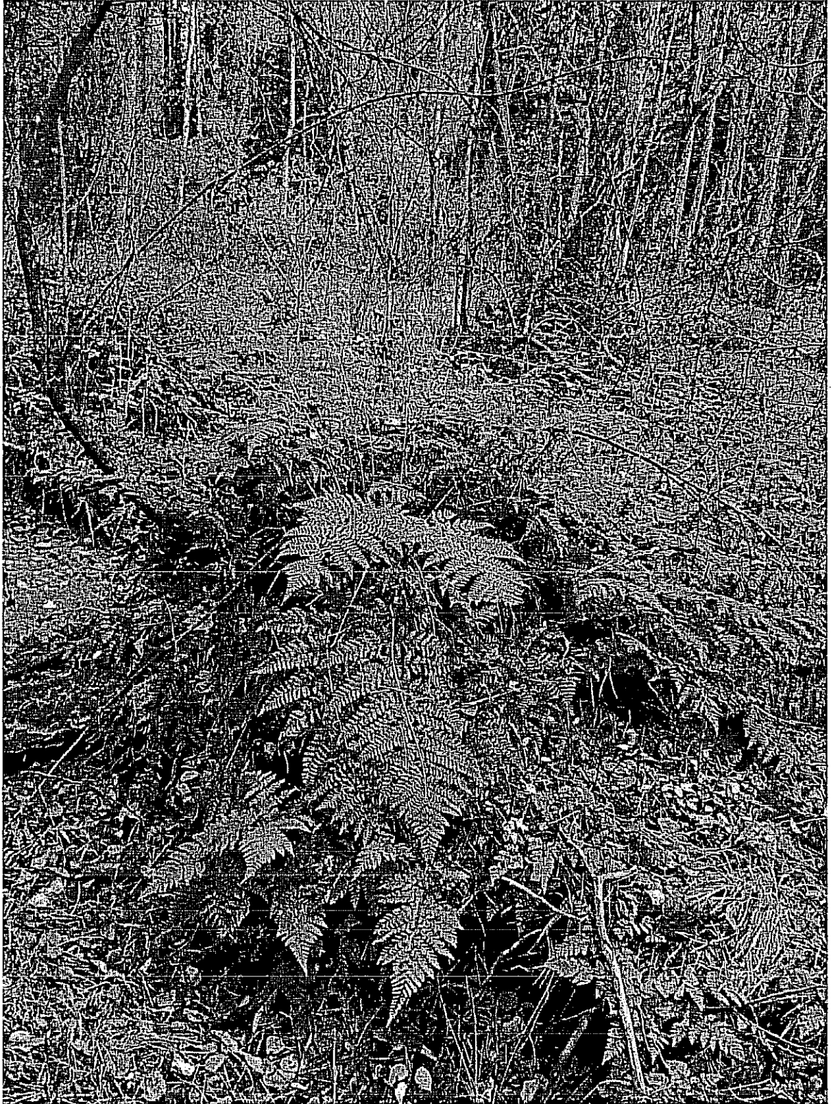
Fot. 5. Nerecznica szerokolistna Dryopteris dilatata .