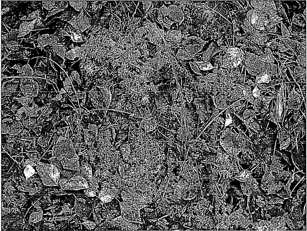
Fot. 3. Kępy torfowca Sphagnum sp.

Fot. 2. Część północno-wschodnia użytku, o charakterze borowym. Widoczne zadrzewione kępy i potorfowe zapadliska pomiędzy kępami.