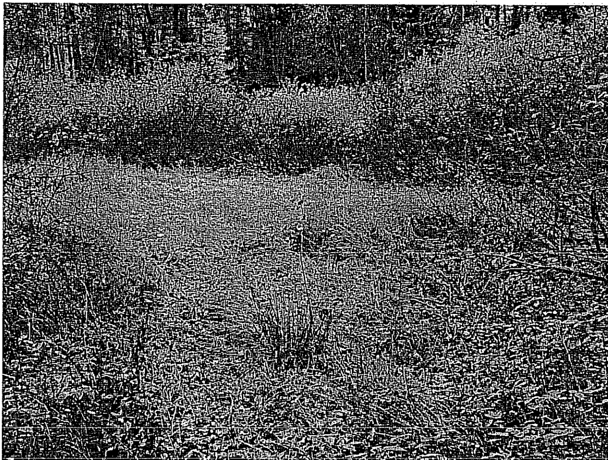
Fot. 1. Widok ogólny projektowanego użytku (część północno-zachodnia).