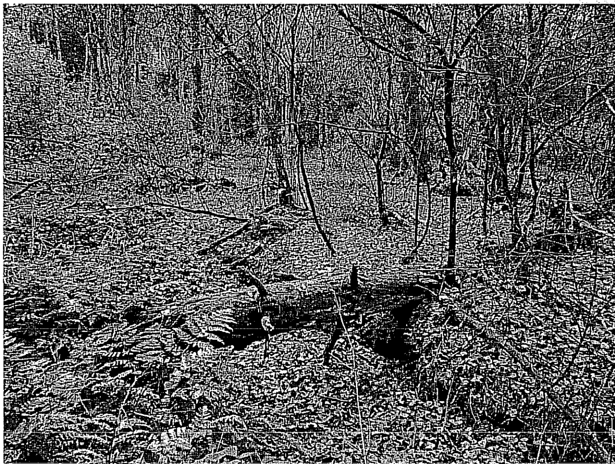
Fot. 4. Widoczne doły powstałe wskutek dawnej eksploatacji torfu.