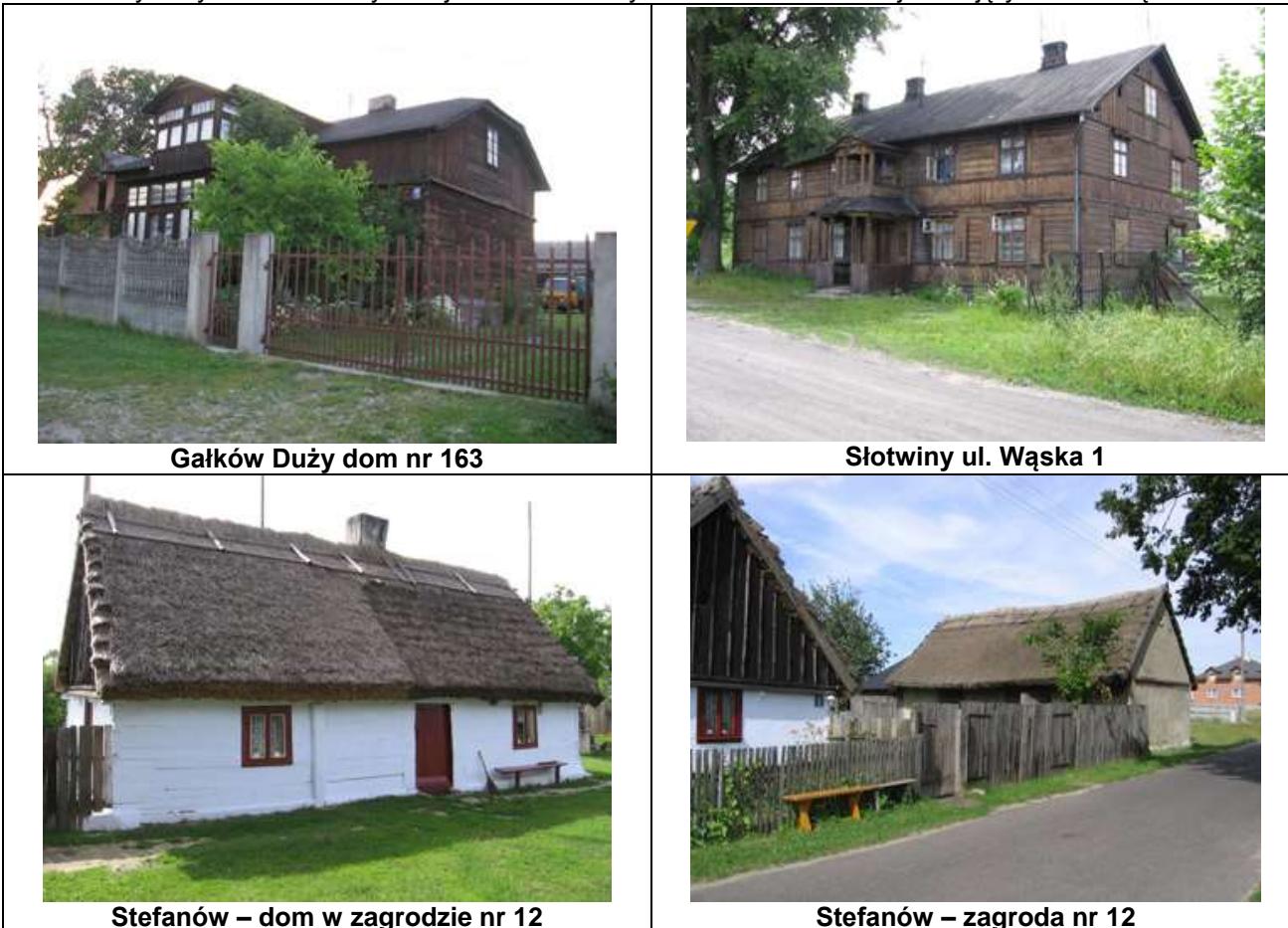
Fot. 1: Przykłady obiektów o wysokiej wartości historyczno-architektonicznej nieobjętych ochroną

Na terenie Gminy można także spotkać murowane budynki z cegły, powstałe na początku XX wieku i w okresie międzywojennym o charakterystycznej sylwecie (zbudowane na planie prostokąta, jednokondygnacyjne, pokryte dachem dwuspadowym) i charakterystycznych dekoracjach elewacji. Najbardziej interesujące i najlepiej zachowane są następujące budynki: