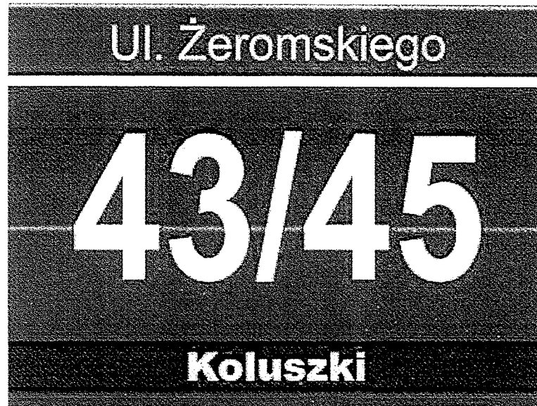
c) Tablica adresowa o wysokości 300 mm i szerokości 300 mm