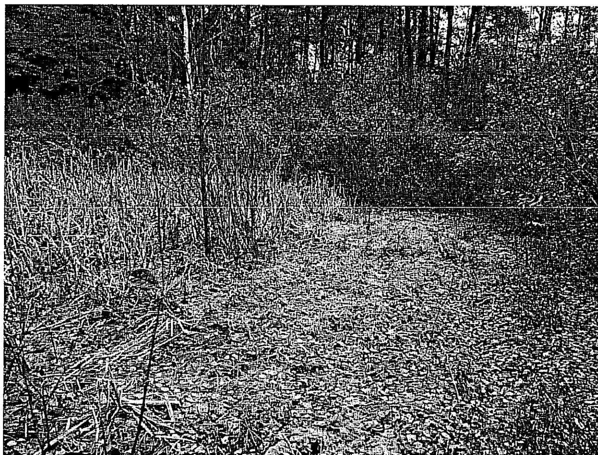
Fot. 5. Mszar torfowcowy na brzegach zarastającego dołu w północno-wschodniej części użytku.