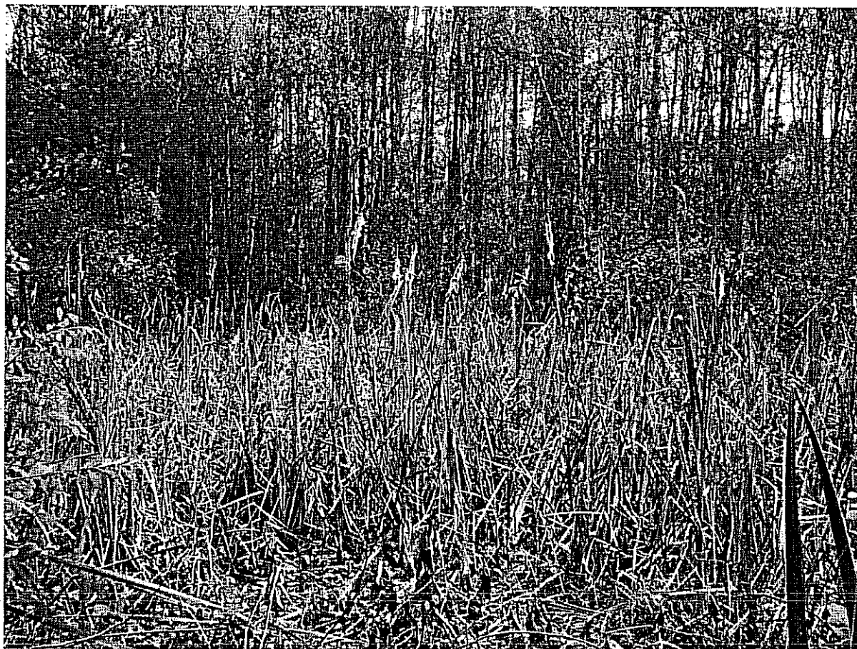
Fot. 4. Dół potorfowy zarośnięty przez szuwar szerokopalkowy.