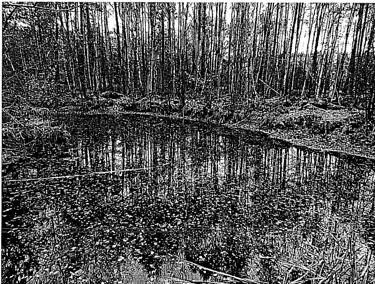
Fot. 3. Rozległy dół potorfowy w początkowej fazie regeneracji.