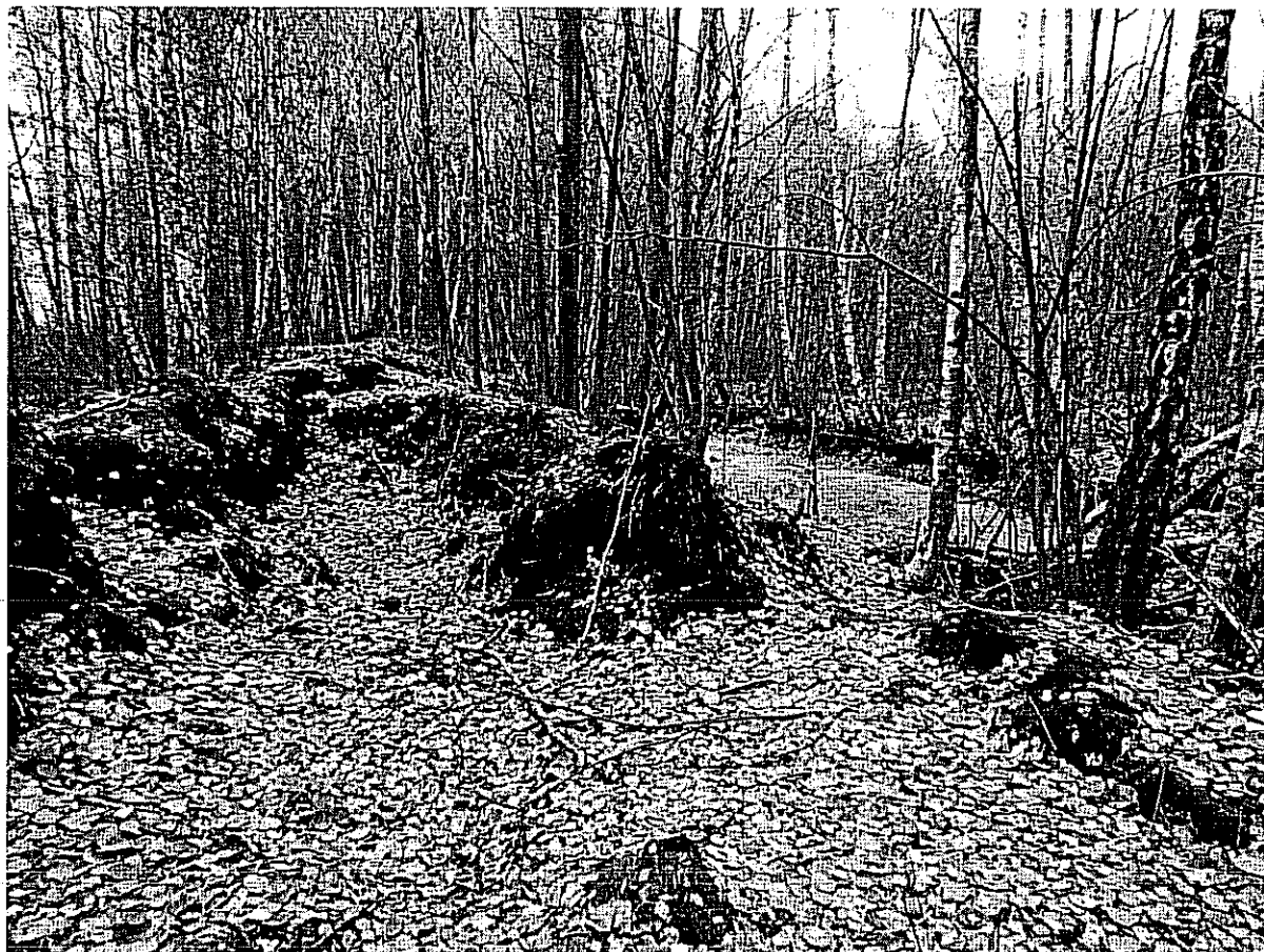
Fot. 1. Widoczna „nadsypana” grobla, porośnięta młodym drzewostanem z dominacją brzozy oraz dół potorfowy