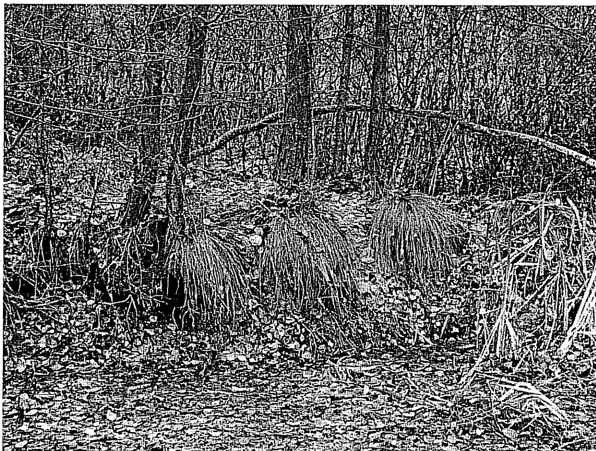
Fot. 6. Grobla z drzewostanem sosnowym i kępami welnianki pochwowatej w runie.