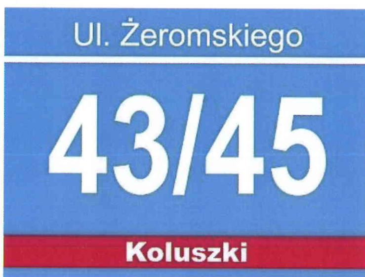
c) Tablica adresowa o wysokości 300 mm i szerokości 300 mm