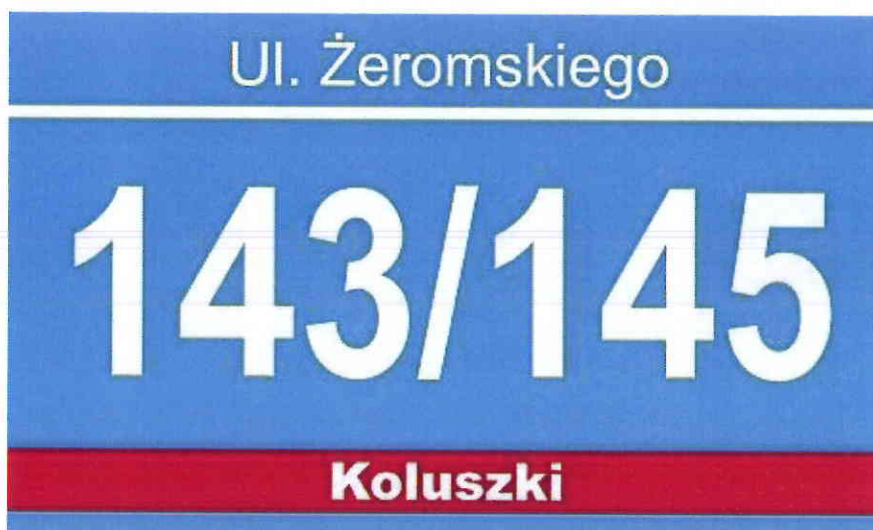
b) Tablica adresowa o wysokości 300 mm i szerokości 400 mm