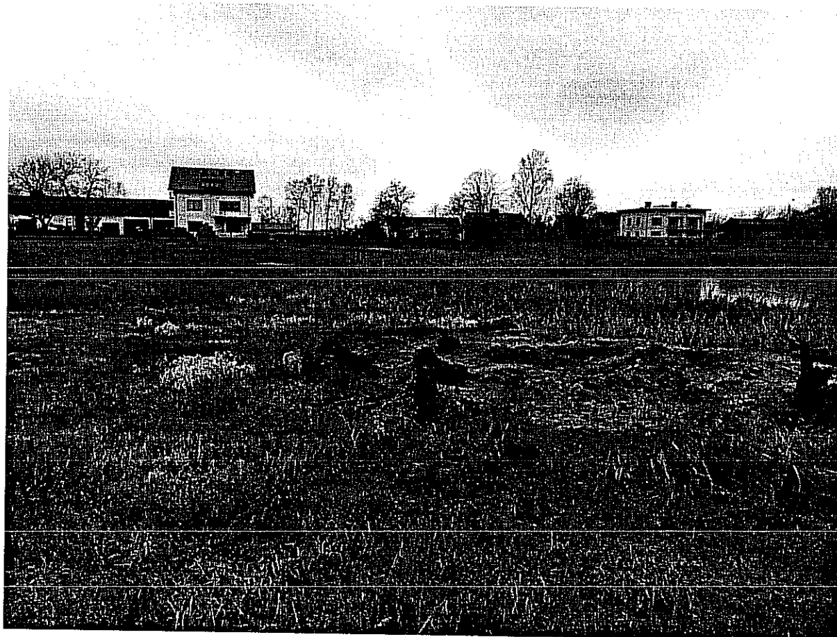
Teren do zagospodarowania przy stawie

W Jeziorku znajduje się charakterystyczny staw, przy którym co roku odbywa się impreza z okazji Nocy Świętojańskiej, które organizuje lokalna społeczność