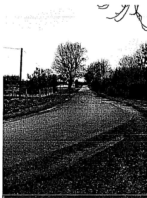
Droga we wsi Jeziorko

Wieś Jeziorko ze względu na swoje usytuowanie posiada dobre połączenie z siecią dróg gminnych i powiatowych w kierunku Koluszek oraz Jeżowa. Ze względu na bliskość stacji kolejowej w miejscowości Wągry – gm. Rogów istnieje również dobre połączenie kolejowe w kierunku Łódź – Warszawa.