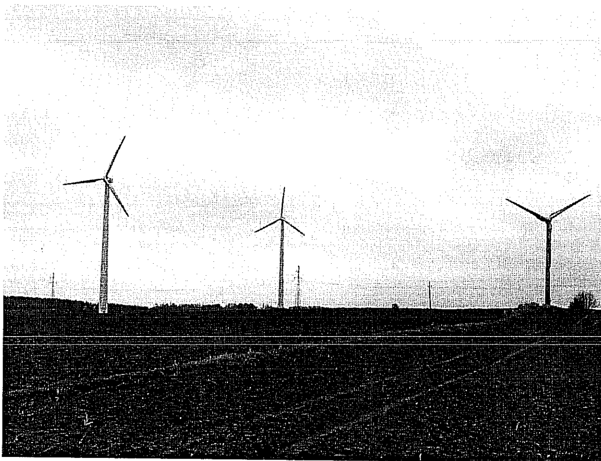
Turbiny wiatrowe we wsi Jeziorko