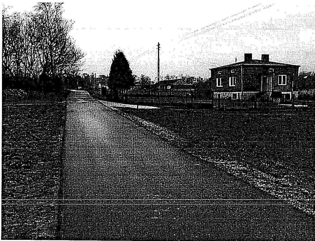
Droga przez wieś Jeziorko