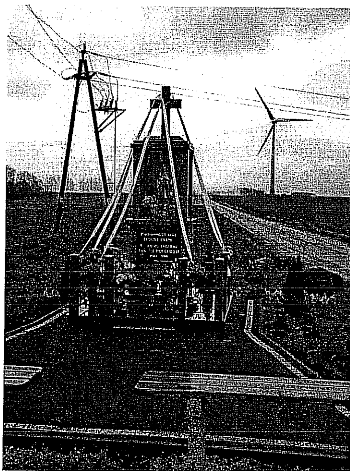
Kapliczka w Jeziorku przy głównej drodze.