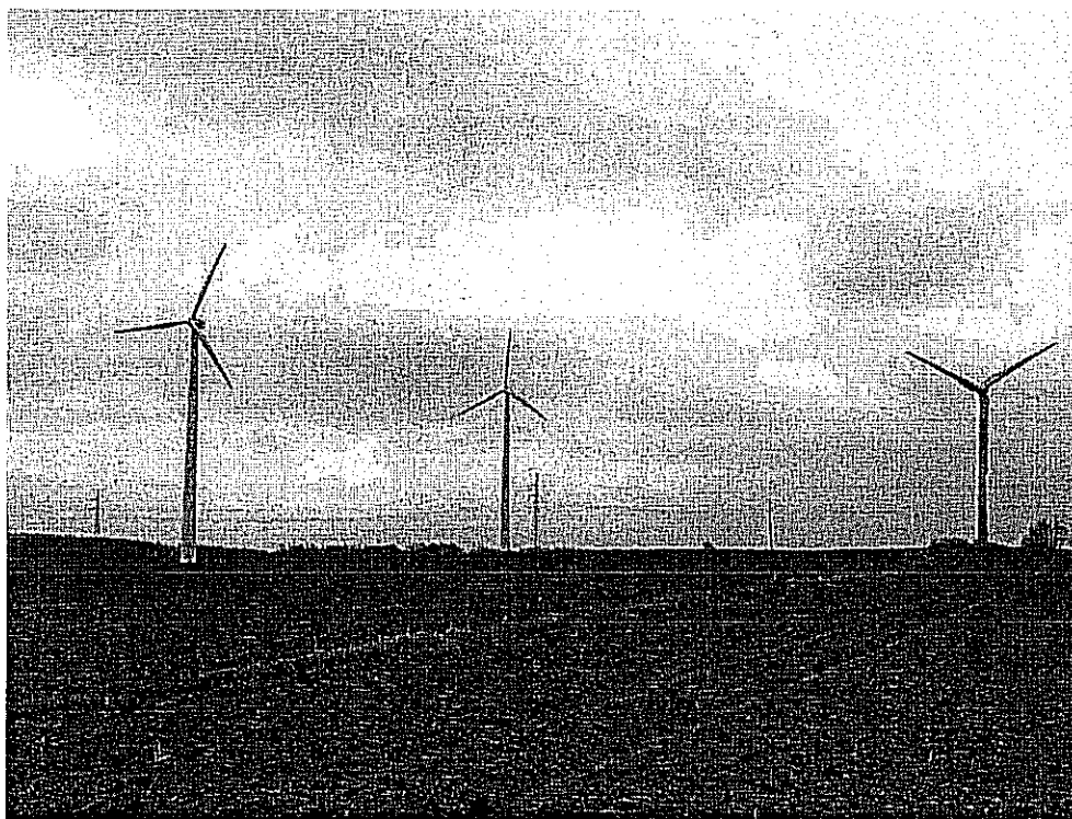
Turbiny wiatrowe we wsi Jeziorko