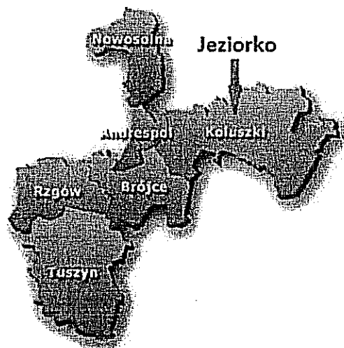
Mapa powiatu łódzkiego – wschodniego

wyniesieniami Garbu Łódzkiego. Dystans dzielący Jeziorko od miasta powiatowego i wojewódzkiego – Łodzi, to ok. 25 km.