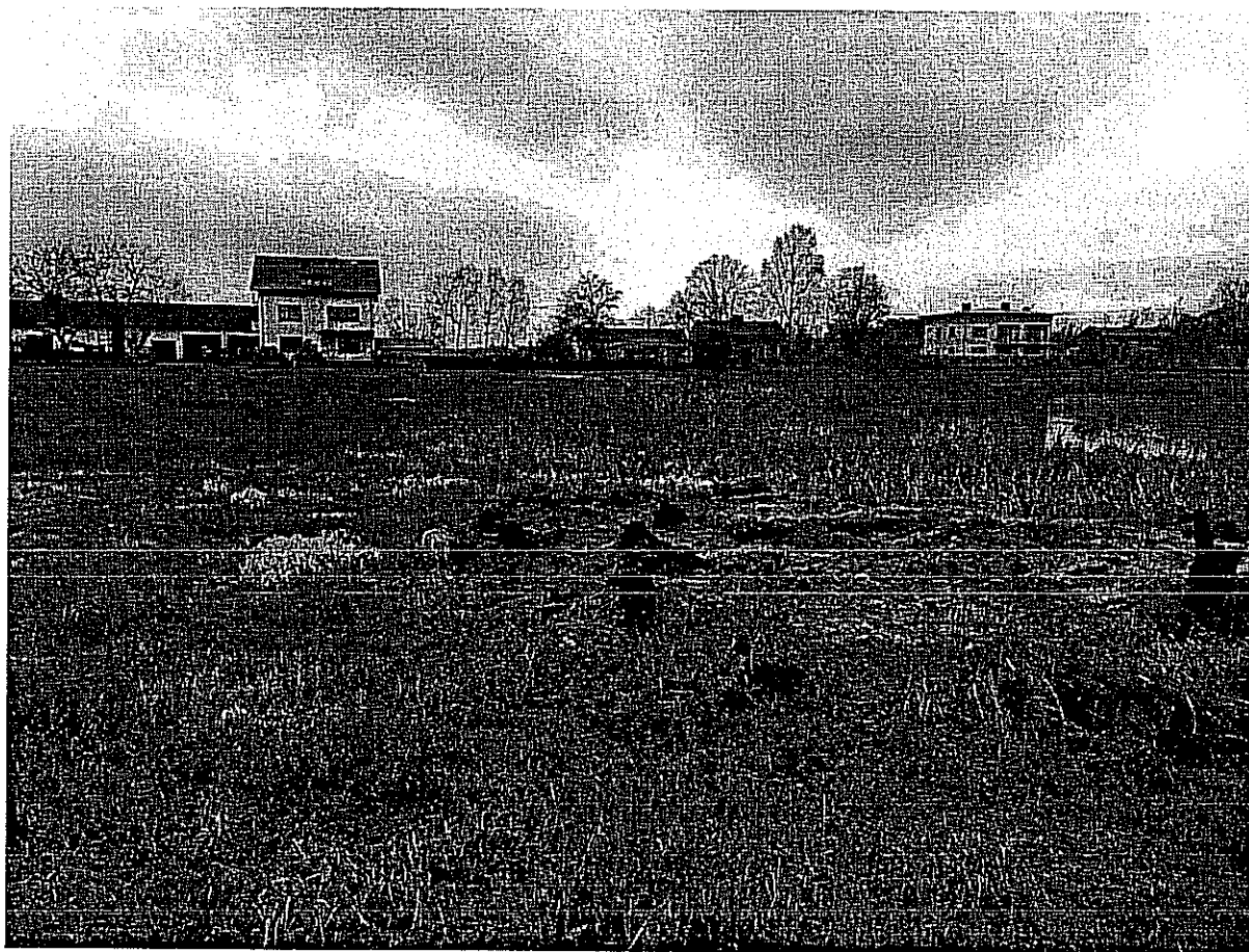
Teren do zagospodarowania przy stawie

W Jeziorku znajduje się charakterystyczny staw, przy którym co roku odbywa się impreza z okazji Nocy Świętojańskiej, które organizuje lokalna społeczność