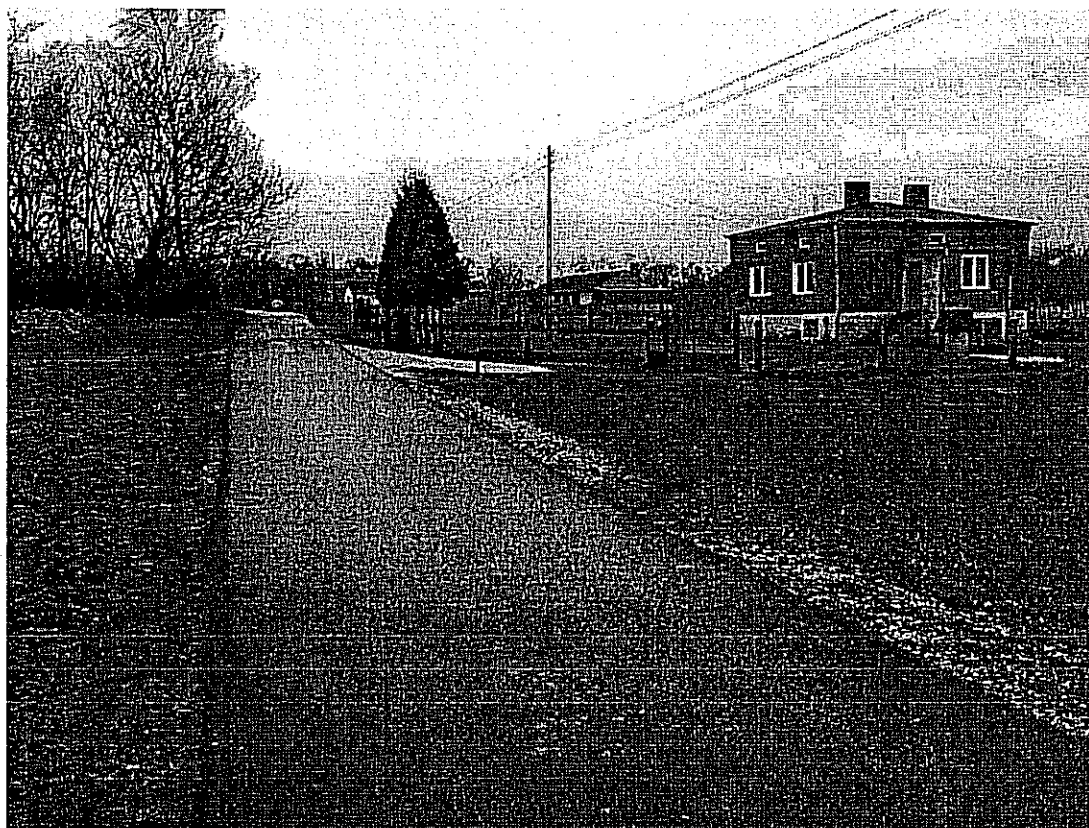
Droga we wsi Jeziorko