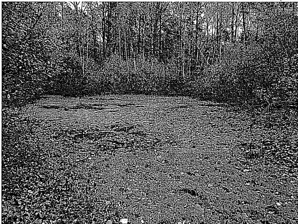
Fot. 1. Centralna część mokradła, z otwartym lustrem wody. Na obrzeżach łożowisko.