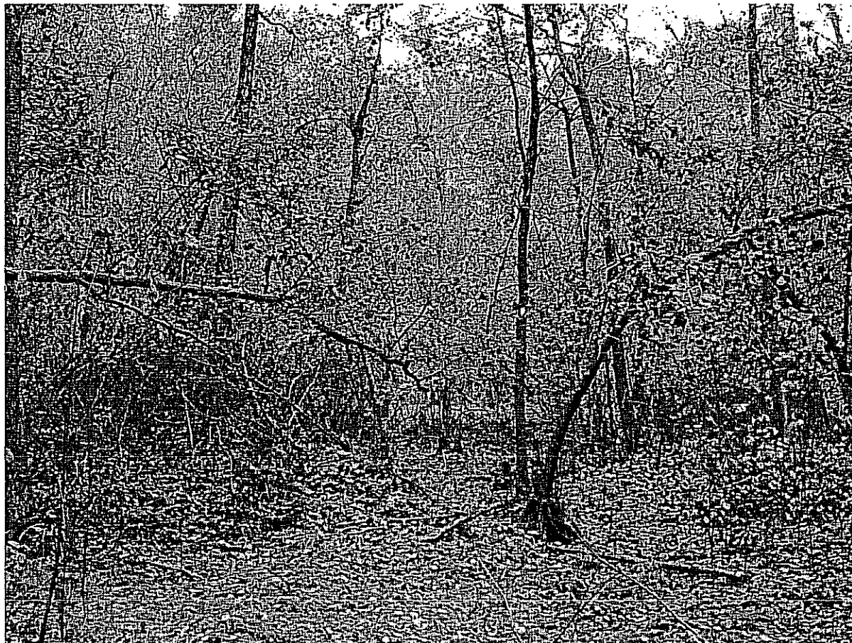
Fot. 4. Płat młodocianego olsu przy północnej granicy użytku.