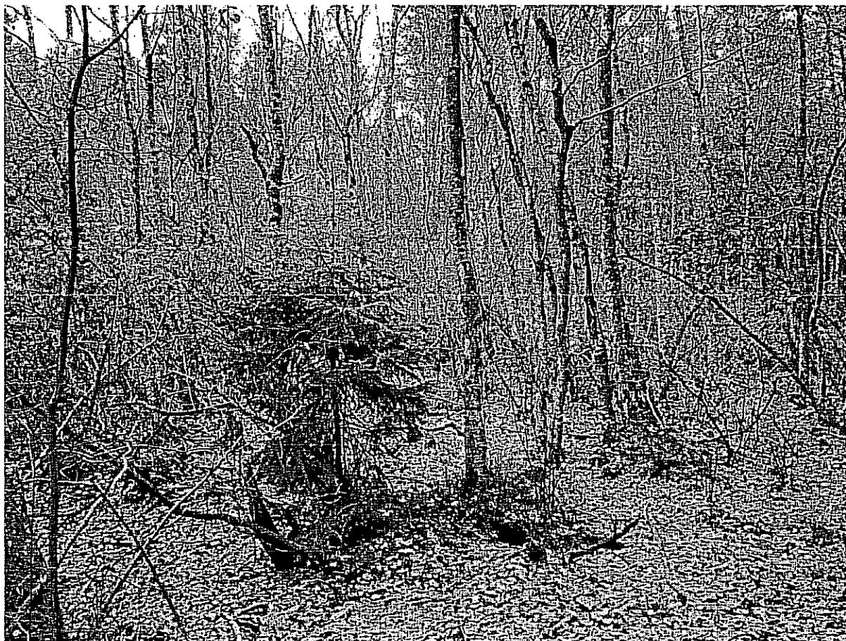
Fot. 2. Młodziąny ols w części południowej.