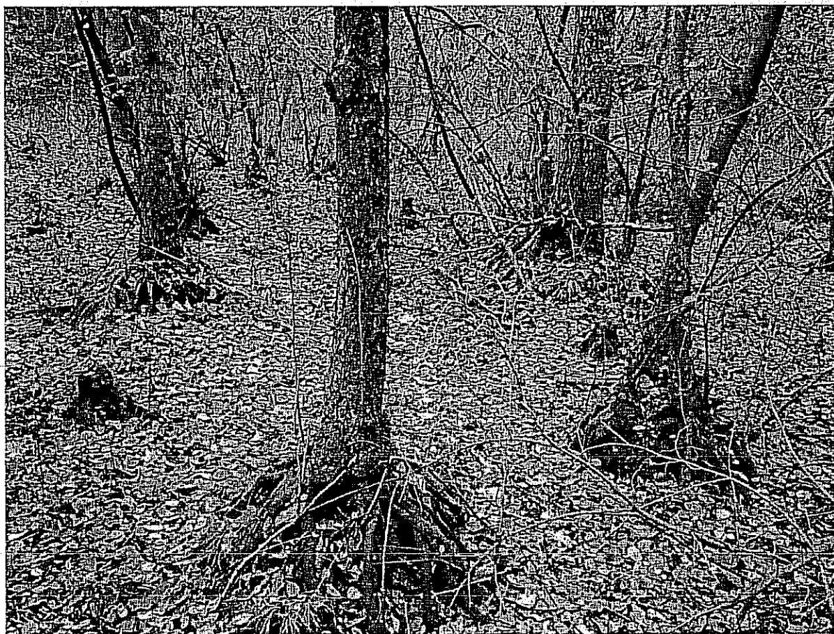
Fot. 3. Dolinkowo-kępowa struktura roślinności młodocianego olsu. U podstawy drzew widoczne kępy turzycy długokłosej Carex elongata .