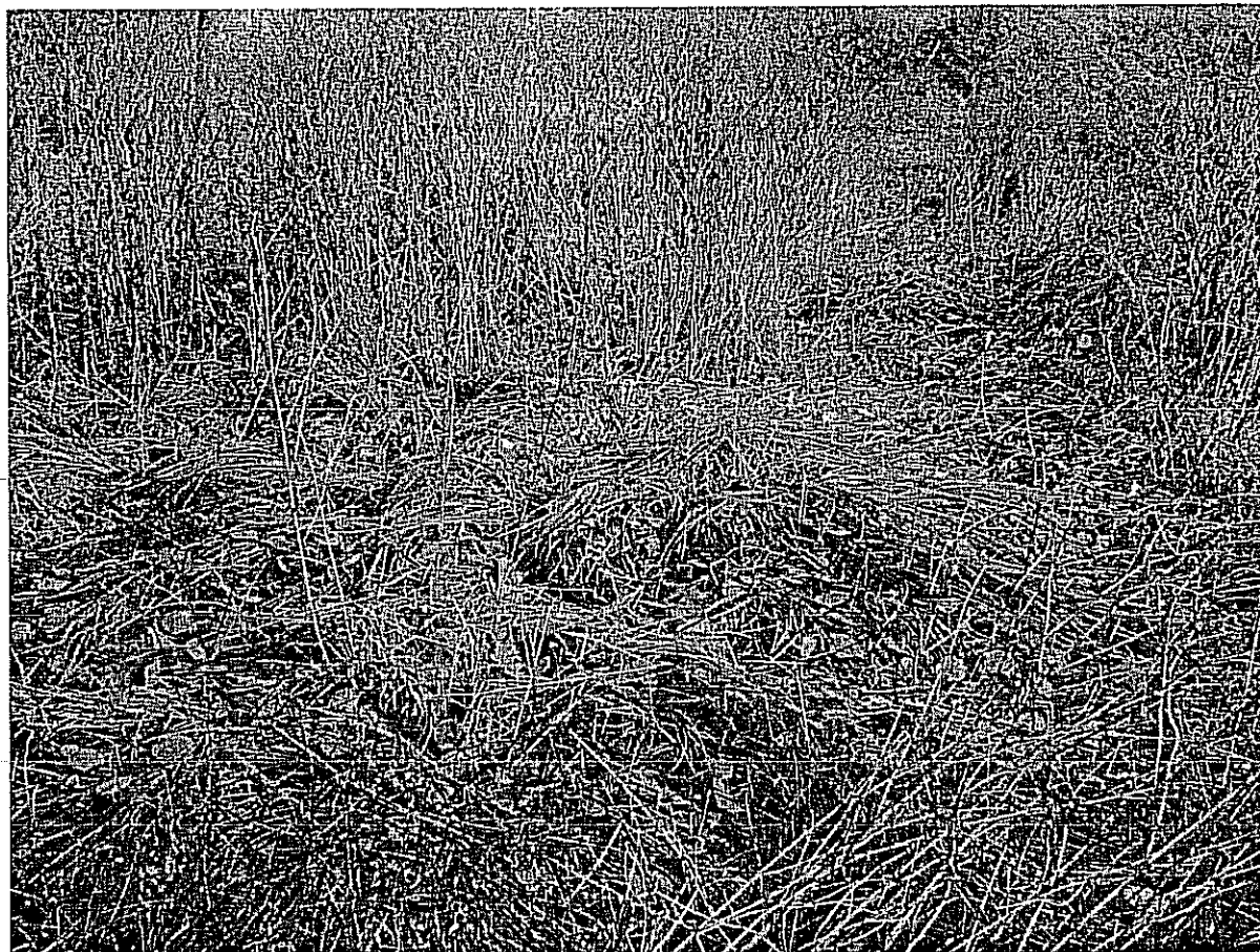
Fot. 3. Kępy turzycy sztywnej Carex elata .