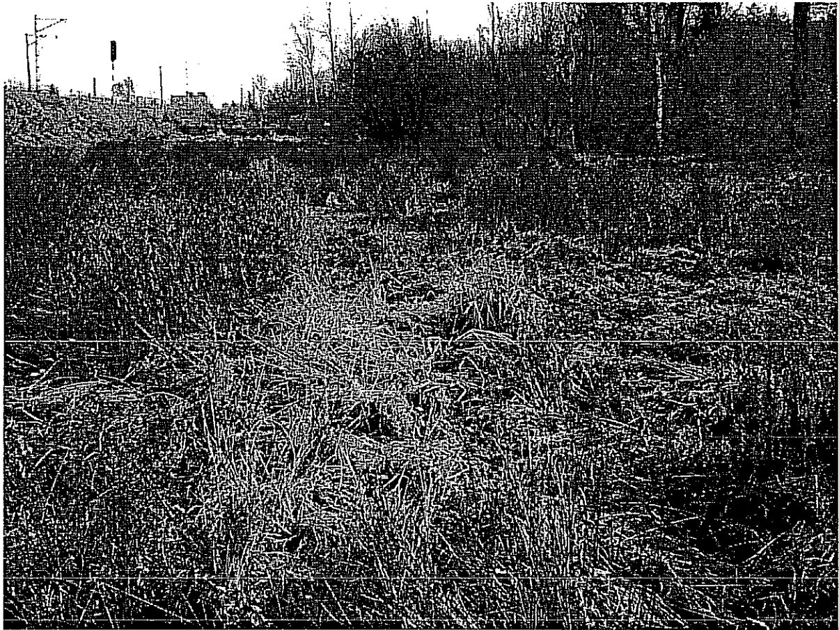
Fot. 1. Zarastające łąki we wschodniej części użytku – miejscami z dominacją uczezu amerykańskiego Bidens frondosa .