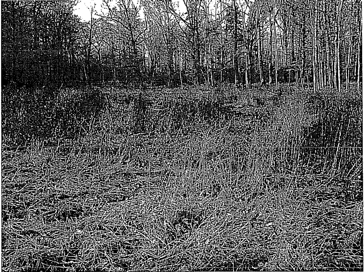
Fot. 4. Fragment zarastających łąk z dominacją mozgi trzcinowej Phalaris arundinacea .