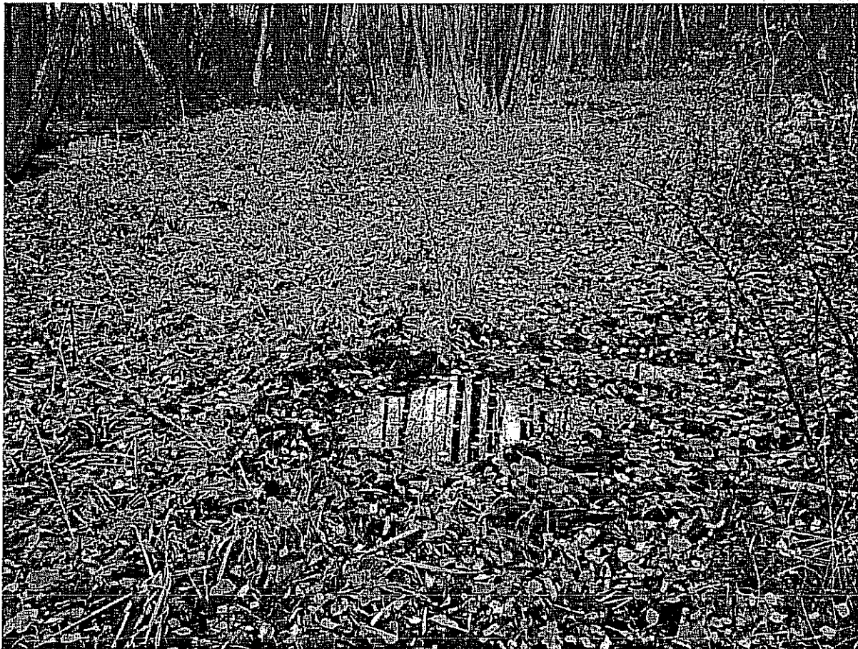
Fot. 1. Łęg i ziólorośla źródliskowe w centralnej części użytku.