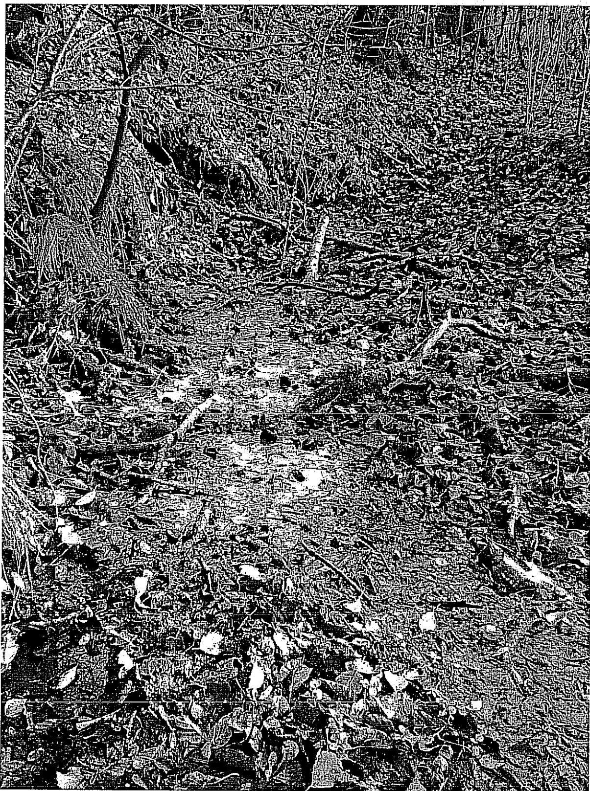
Fot. 2. Podstokowe źródło o dużej wydajności.