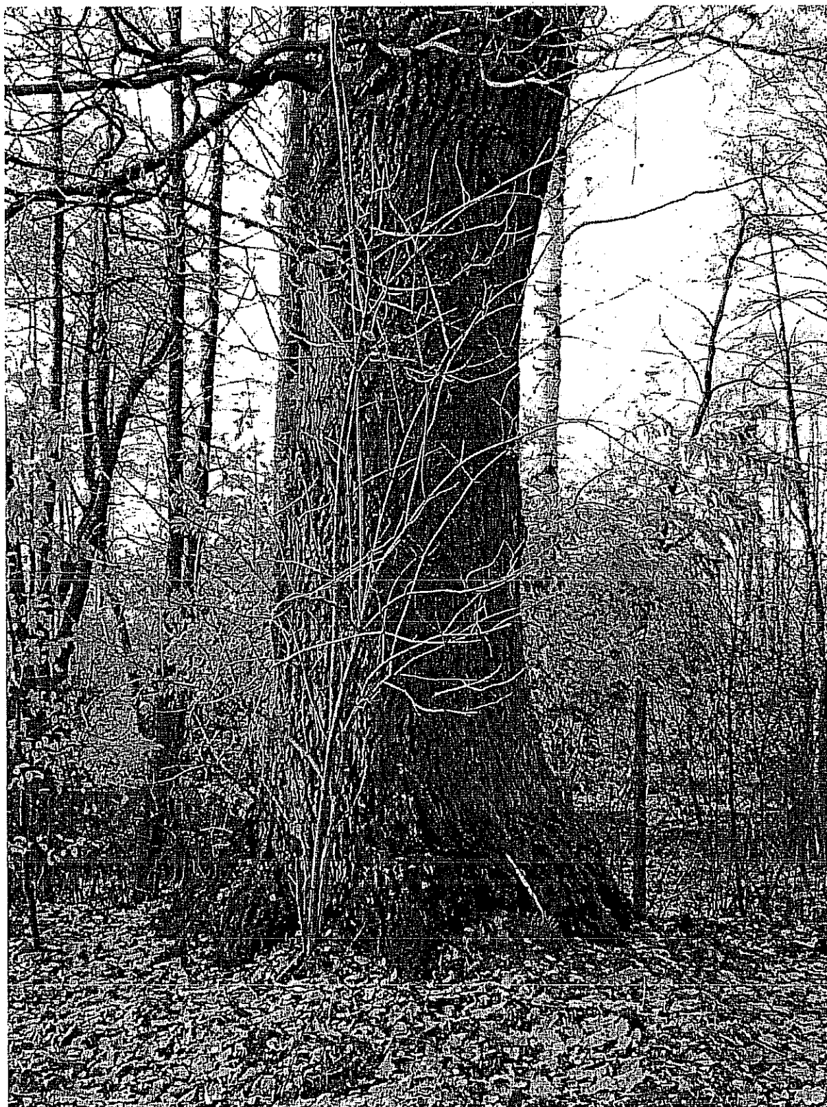
Fot. 4. Okazały dąb na krawędzi skarpy doliny.